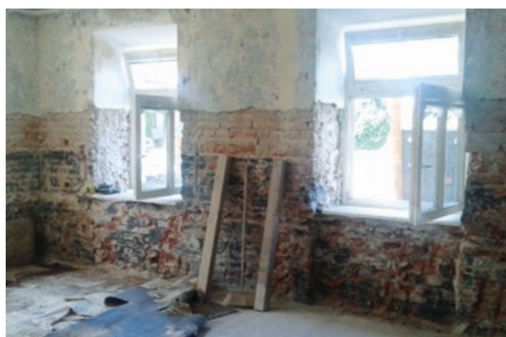
Opravy prostor v základní škole.