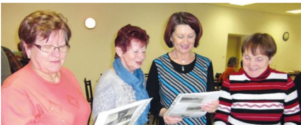
Členky klubu Aktivní senior.