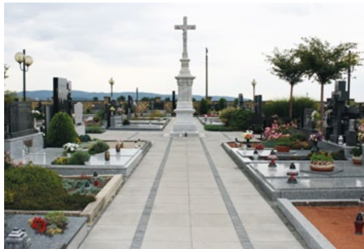
Nové chodníčky na hřbitově.