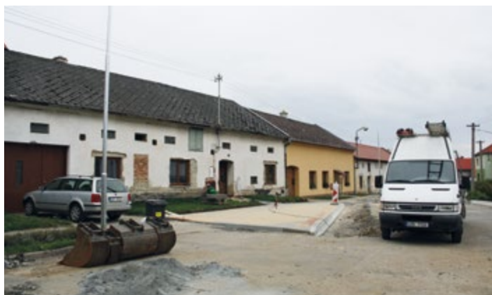
Nové nástupní místo pro cestující autobusem.