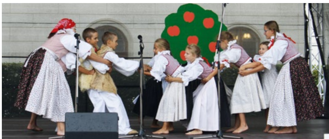
Jabloňka na Dožínkách v Holešově.