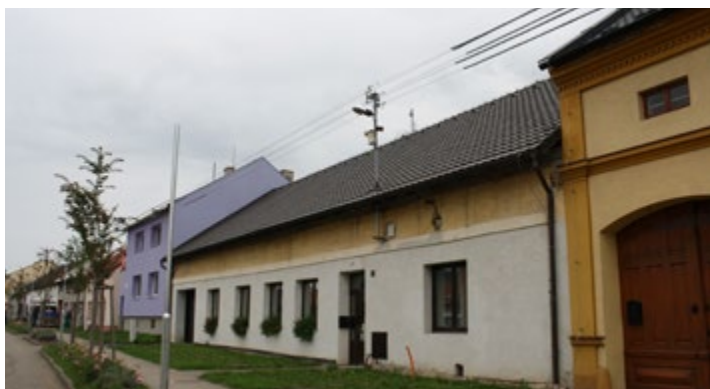
Nadzemní vedení z drátů zmizí, místo toho budou v obci nové sloupy.