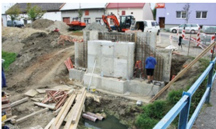
Oprava lávky na návsi.

částečně vyřeší výše uvedené problémy. V projektu se počítá se stavbou lávky, která zajistí bezbariérové propojení obou částí návsi a úpravy křižovatky silnice III/49016 s místní komunikací. Dále budou postaveny bezbariérové zastávky linek autobusů včetně nástupových ploch, přístupových chodníků a místa pro přecházení. To výrazně zvýší bezpečnost dopravy na západním okraji návsi.