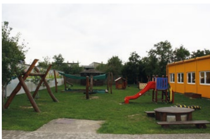
Hřiště za mateřskou školou.