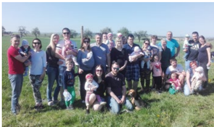
Někteří malí občanci už mají zasazený svůj strom v rodinné aleji.

žek cvičení). Byla také opravena a zbavena vlhkosti chodba a schodiště, vyměněna okna a zatepleny stropy v kancelářích obecního úřadu. Z kapacitních důvodů se rozšířila knihovna, pro kterou obec stále hledá větší prostory. Dvůr obecního úřadu byl oddělen od hřiště mateřské školky plotem, který byl pomalován obrázky pohádek pro větší pohodu dětí.