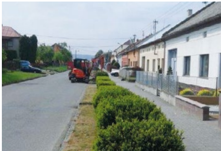
Zeleň v obci před dotací.

V roce 2014 došlo k rozšíření kapacity mateřské školy. Spolu s tím začalo dětem chybět aktivní využití volného času v blízkosti školky. Obec děti zapojila do projektu, mohly sdělit či nakreslit svou představu o tom, jaké herní prvky by na hřiště chtěly mít a s čím by si chtěly hrát. Na podobě hřiště se podílely i děti z místního hasičského kroužku a z folklorního souboru Jablůňka. Děti si přály, aby se na hřišti mohly scházet se svými kamarády, a proto zde byly umístěny i lavičky a stoly a 16 herních prvků. Například housenka, vahadlová houpačka, hnízdo, mini houpačky, dendrofon, zvukovadlo, pískoviště, spirála a další. Akce byla hrazena z dotace ministerstva pro místní rozvoj. Celkové náklady činily 303 105 Kč, obec hradila 90 932 Kč. ▶