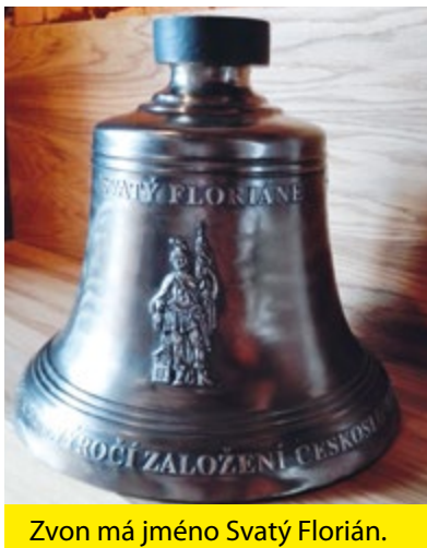
Zvon má jméno Svatý Florián.

Florián, váží 50 kilogramů a má průměr 44 centimetrů.