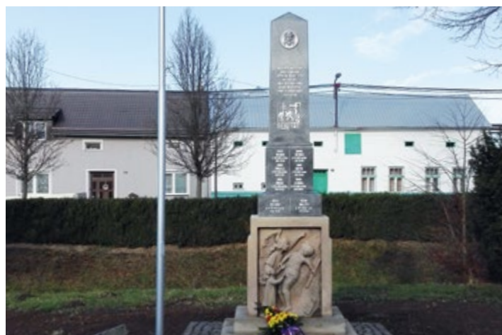
Opravený Pomník padlých.