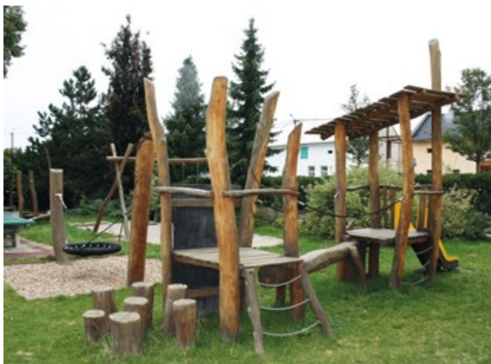
Hřiště u základní školy.

Strategický plán obce je dokument, který má vypracovaný každé město a každá obec ve Zlínském kraji. Jedná se o klíčový plán, ve kterém mají zastupitelé naplánované investice a rozvoj obce na budoucí léta, a kterým se řídí. Dokument je také velmi důležitý při žádání o dotaci. Pokud je žádost o dotaci v souladu se strategickým rozvojem obce, získává vesnice plusové body a má tak vyšší šanci na finance dosáhnout. Martnice nechaly strategický plán vypracovat v roce 2015 a už