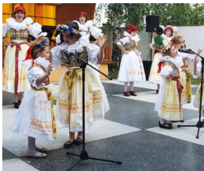
Omladina v Rymicích.

výkon při vystoupení. Je to pro nás poděkování za naši snahu a ochotu obětovat svůj volný čas ve prospěch našeho sdružení. Udržet v činnosti soubor ve velkém počtu členů je po ekonomické stránce též dost náročné, neboť finanční podpora spolek, jak máme my, je od obce ve výši 20 000 korun za rok. A musí nám stačit. A to nemluvíme o náročnosti oprav a údržby krojů. Obci za podporu velmi děkujeme. Závěrem je třeba poděkovat všem členům souboru, kteří svým vystoupením dobře prezentují obec Martinice a široké okolí Holešovska, a jdou tak příkladem pro budoucí generaci.